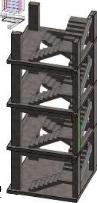
3 stairs 3D